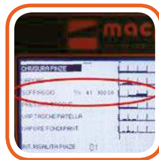
Regolazione quantità soffiaggio con inverter Regulatable blowing power with inverter