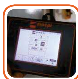
Programmatore Touch screen 5,7" removibile. 5,7" removable touch screen programmer