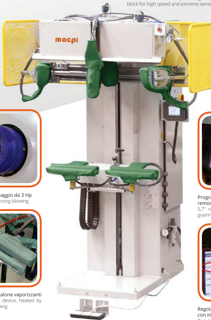
Antistretch device for top and leg, double cylinder with mechanical block for high speed and extreme sensitivity for stretching fabrics