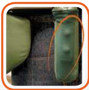
Stiro tasche/patella vaporizzante Pocket/Flap pressing device, heated by steam and steaming