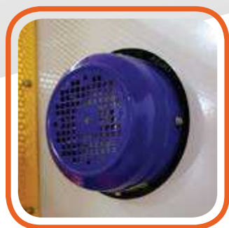
Motore per soffiaggio da 3 Hp 3 Hp motor for strong blowing