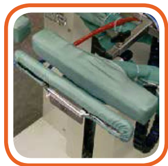
Stiro fondo pantalone vaporizzanti Bottom pressing device, heated by steam and steaming